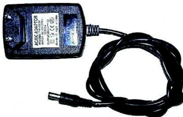
Figura 1 - Fonte