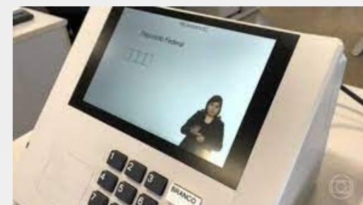
Foto em ângulo lateral do teclado de eleitor da urna eletrônica no momento da votação, quando o eleitor tecla no número 2.