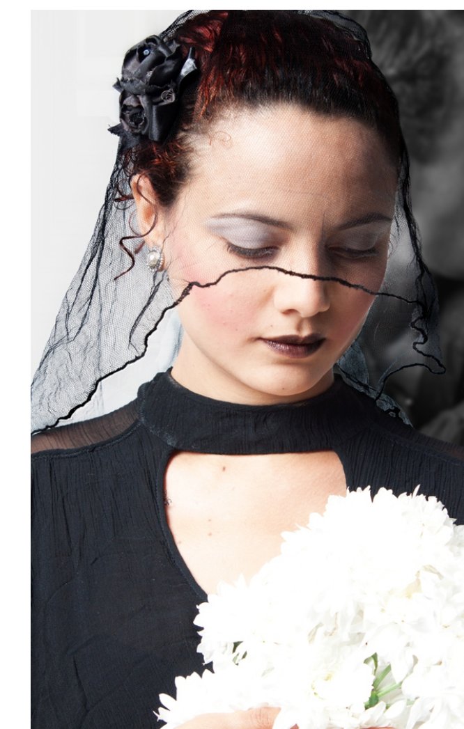
VESTIDO DE NOIVA

Autor de obras definitivas como Vestido de noiva, O Beijo no Asfalto, Boca de ouro, Doroteia; Nelson Rodrigues é, reconhecidamente, o revolucionário dramaturgo que inaugurou o processo de modernização do teatro brasileiro.