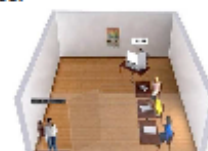
layout da sala de votação (sugestão)