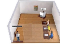
Layout da sala de votação